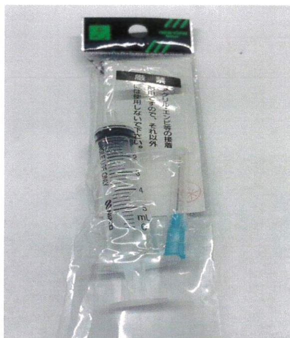
④ 本体と針を入れる。