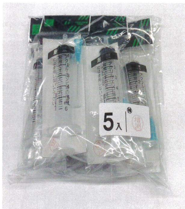
⑥ 5入り袋に入れて完成。