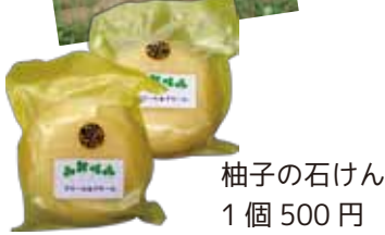
柚子の石けん 1個 500円