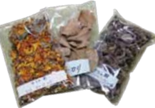
サシェ用ドライフラワー 300円