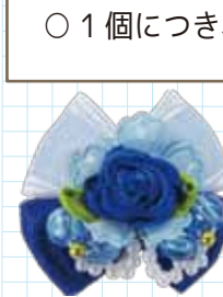
こんなにかわいいリボンの土台です!